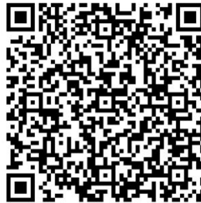
联合大学-北四环校区